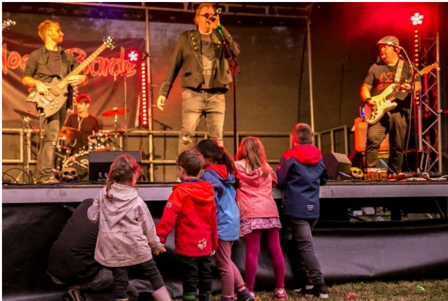
Endlich wieder Ackerparty!

Das Wetter war durchwachsen. Trotzdem hatten viele Menschen Lust auf Musik und Feiern. Die Veranstaltung war ein Erfolg.